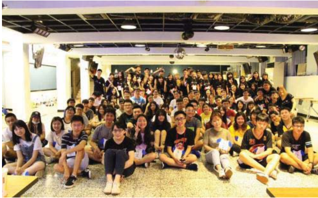
▲法律系學會於潛水艇的天空舉辦迎新茶會

2018年9月開學前夕，法律系及財法系學會分別為大一新生舉辦迎新茶會，歡迎學弟妹們加入法律學院這個大家庭，在學長姊的帶領下認識輔大校園、熟悉環境、了解系上人事物，為大學生活展開序幕，開心從容地迎接大一新生活！