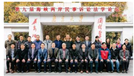
▲第九屆海峽兩岸民事訴訟法學術研討會合影