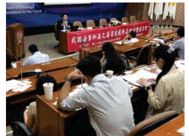
▲我國海事私法之海商規範修正研討會