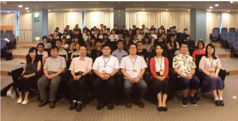
▲前排為本院教師與來訪師長們

2018 年 9 月 21 日日本琉球大學、佐賀大學、東京大學與輔仁大學法律學院師生約近百人，齊聚於濟時樓九樓國際會議中心進行交流活動。活動中本院學生進行「行政契約於民法債編各論中有名契約上之適用可能性-以贈與契約為例」及「清末禮法之爭-論〈附加章程〉中『無夫姦』罪與清末社會變遷之關係」專題報告；日本佐賀大學提出及琉球大學則分別提出「同性婚姻的法律議論與 LGBT 的權利保障—兼論台灣司法院的判斷」及「夫妻別姓」專題報告。在雙方師長帶領下，場