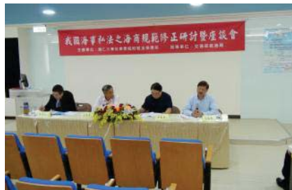
▲我國海事私法之海商規範修正座談會

2018年9月13日假本校野聲樓谷欣廳召開「我國海事私法之海商規範修正研討會」及2018年10月9日假交通部航港局敦南大樓演講廳召開「我國海事私法之海商規範修正座談會」，透過本次研討與座談，期使我國未來海商法之修正能更正確、更周延、更符合各界需求。