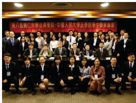
▲第八屆輔仁大學法律學院-中國人民大學法學院學生圓桌論壇合影

2018年12月11日在本校召開「第八屆輔仁大學法律學院—中國人民大學法學院學生圓桌論壇」，本次論壇由兩院學生擔任報告人及與談人，針對公法、財經法、民商法、刑事法四大領域相互比較兩岸在法治上的『同』與『異』，透過不同文化背景，激盪出不同火花。