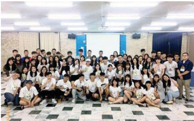
▲財法系學會於利瑪竇1樓舉辦迎新茶會