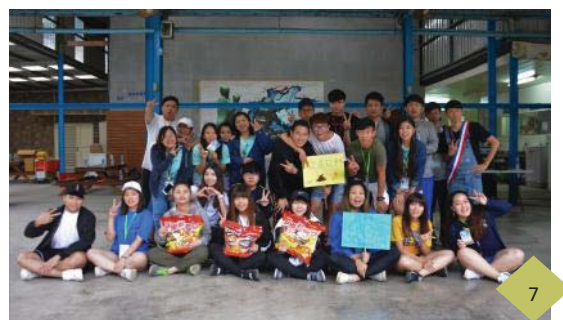
▲進修部法律系學會迎新宿營活動