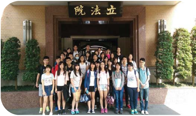
▲ ALSA 與會人員

為與實務接軌，ALSA 輔大分會幹部積極申請赴各機關參訪之機會，敲定 2016 年 4 月 6 日及 4 月 29 日分別參訪台北地方法院以及立法院。同學們對於此系列活動皆表示有相當大的收穫，而立法院的參訪因為實屬難得，更開放全法律學院同學報名參加，達到法律學院資源共享的理念與精神。