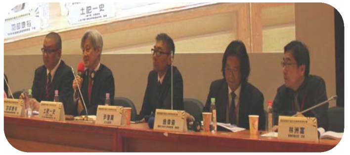
▲ 土肥一史教授 (左二)

2016 年 4 月 28 日本院與台大法律學院科技倫理與法律中心、智慧財產培訓學院等單位，假台大法律學院國際會議廳舉辦「第四屆著作權法法制學術研討會」，會中邀請長期參與日本 TPP (跨太平洋戰略經濟夥伴關係協議) 談判工作之土肥一史教授(一橋大學名譽教授暨日本大學大學院知的財產研究科)來台分享經驗與看法。本次研討會主題著眼台灣著作權領域在近年最受民眾關切之加入 TPP 對於著作權法制影響，及著作權整體修法草案。