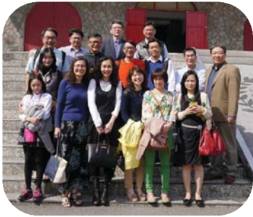
▲ 1989年畢業學長姐合影

1989年、1991年法律學系財經法學組以及1988年法律學系法學組畢業的學長姐，分別在2016年3月7日、2016年7月9日和2016年7月23日舉辦畢業同學會，並在聚會結束後到校園各處走走懷念一下學生時代的點點滴滴。