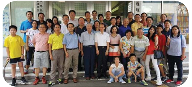
▲ 1988年畢業學長姐合影