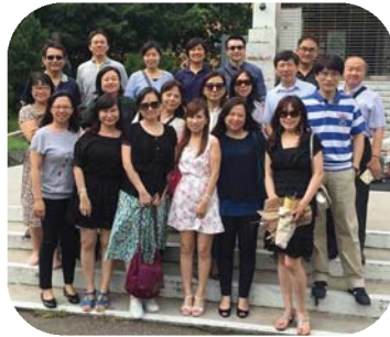
▲ 1991年畢業學長姐合影