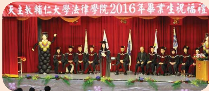
▲ 師長致詞，祝福畢業生