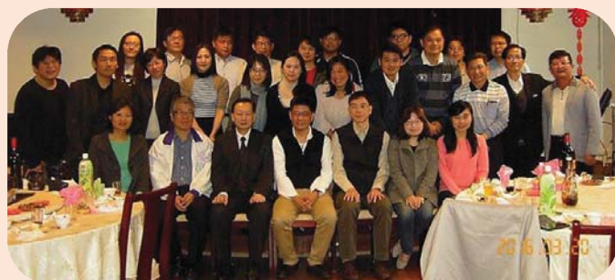
▲ 學法系新春團拜合影

2016年3月20日於新北市議會餐廳舉行，參與師生約三十人。系友分享考取經驗或目前工作狀態及未來規劃，也鼓勵學弟妹努力學習。活動過程中系友憶起昔日求學過程，與學弟妹們引發連結笑聲不斷，聚會在溫馨熱絡的氣氛中結束。